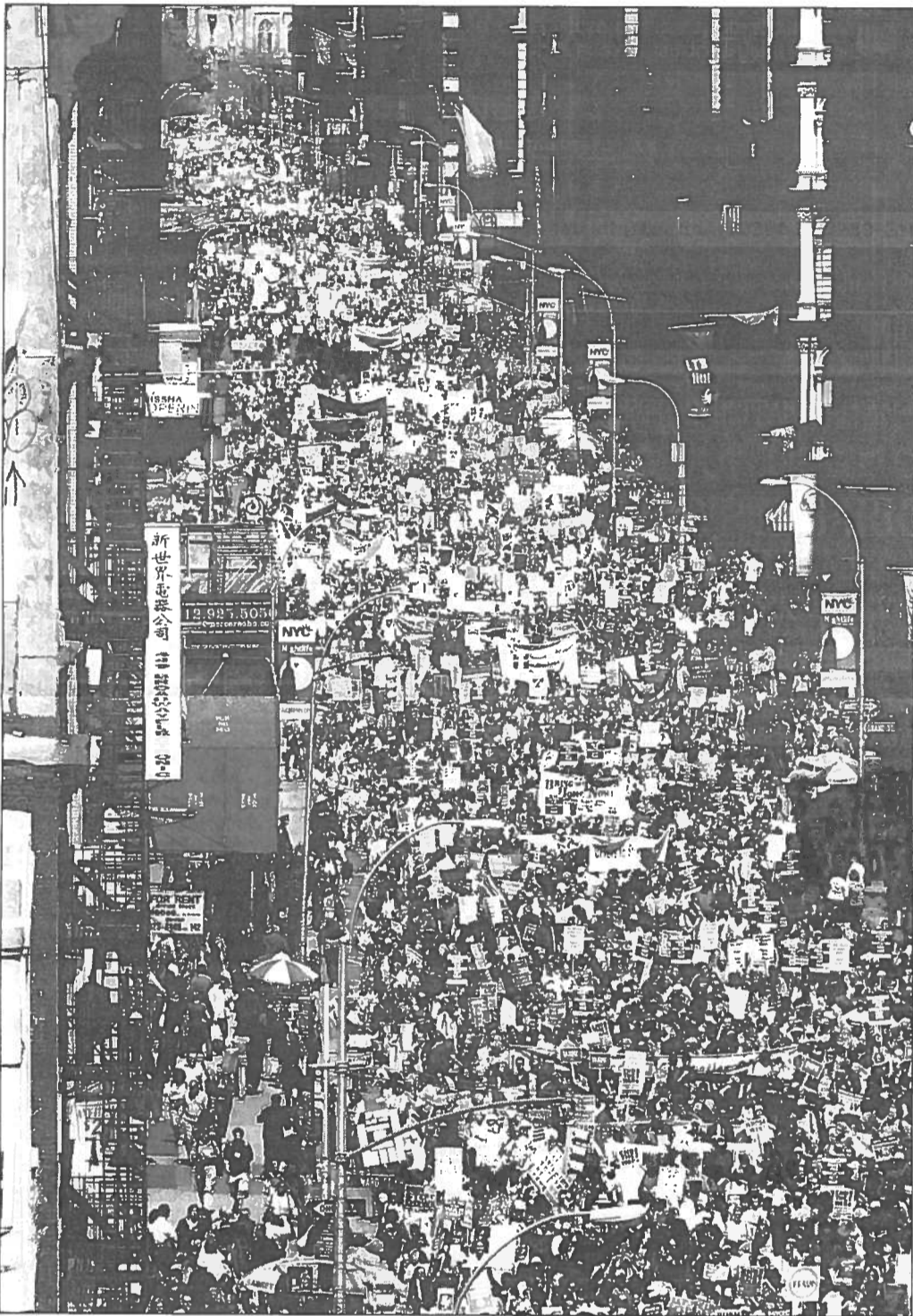
Miles de manifestantes antibélicos se congregaron en el sur de Manhattan para exigir el retiro inmediato de las tropas destacadas en Irak.

Esa cifra no asciende a la de los meses más cruentos durante el conflicto de Irak, pero dobla la de marzo, cuando murieron 31 soldados. La cifra de enero fue de 62 y 55 en febrero. En diciembre murieron 68 estadounidenses.