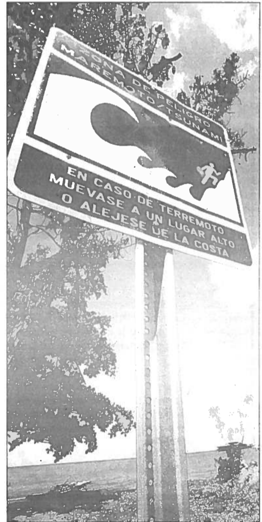
Estos letreros indican las zonas en peligro ante la posibilidad de azote de un tsunami.