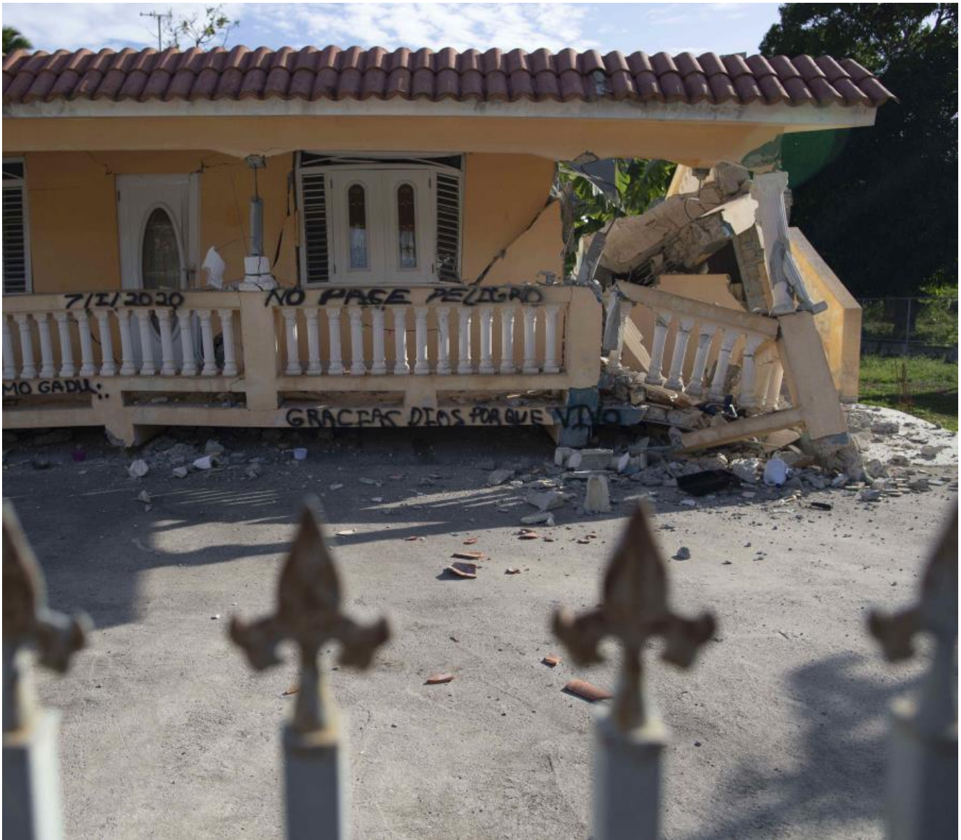
Una residencia afectada por el terremoto del 7 de enero.

El Servicio Geológico de Estados Unidos (USGS, por sus siglas en inglés) publicó este miércoles un nuevo informe sobre los terremotos en Puerto Rico en el que asegura que las réplicas del sismo 6.4 del 7 de enero “persistirán durante años o décadas”.